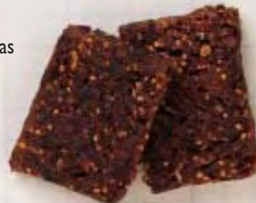
PASTA OSCURA CON SEMILLAS