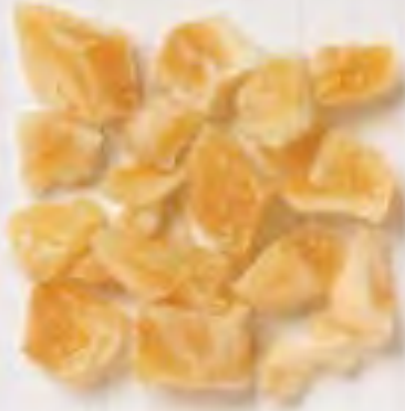
HIGOS TRAY DRIED KADOTA (SECADOS EN BANDEJA)

Todos y cada uno de los productos hechos de ingredientes de higo de California proporcionan un gran sabor y una fuente concentrada de valiosos nutrientes. Los productos mostrados son excelentes adiciones para cualquier artículo alimentario, pero son especialmente apropiados para alimentos horneados. Todos nuestros productos Blue Ribbon Orchard Choice pueden hacerse a la medida para sus exigentes especificaciones. Los higos Blue Ribbon Orchard Choice de California pueden servirle como fuente de sabor y nutrición.