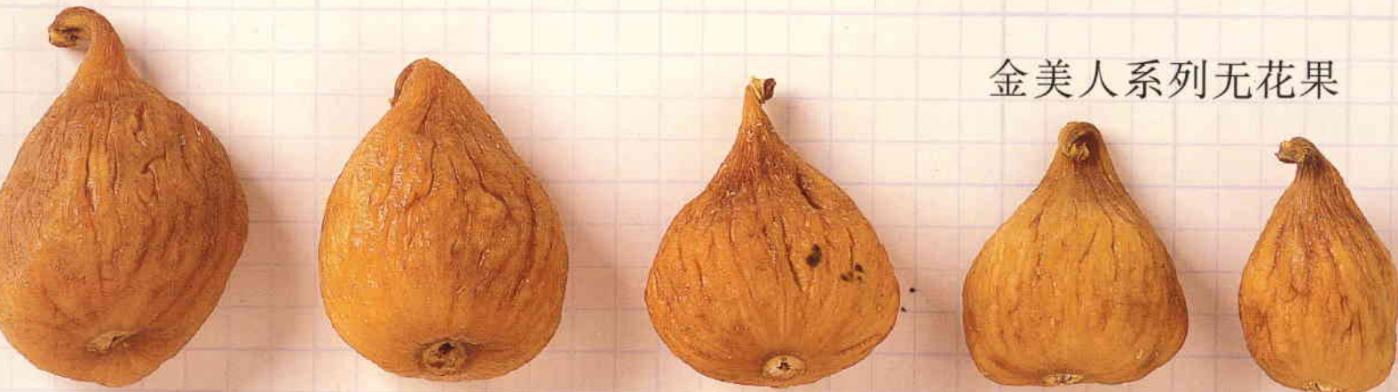
金美人系列无花果